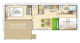
Mistral GRANDE LARGEUR + BRISES VUE TERRASSE COULISSANTS